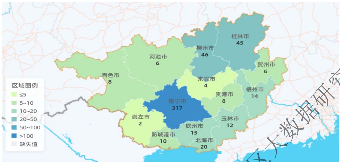
图 2 广西虚拟现实相关企业分布情况