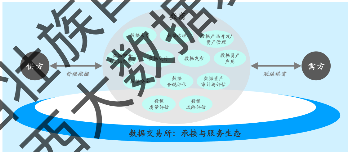
图 1 数据交易所承接与服务数商生态

一是寻求能力互补，形成端到端服务能力。对数据商而言，随着数据要素流通链条的打通，将有更多供需方客户需要一站式、全链条的服务，因此要求数据商增强其全栈的业务能力。靠近数据供方的数据商对数据供方的数据目录、数据质量、数据类型了解程度高，在数据采集、数据治理的传统服务外，积极向下游拓展数据产品开发/数据资产管理、数据中介（数据经纪）业务，为供方实现数据资产化、资本化；靠近数据需方的数据商更能精准高效把握需方数据需求，可积极向上游探寻合适的供方数据，拓展数据采集、数据治理、数据产品开发/数据资产管理、数据经纪服务；在业务能力发展方面较为聚焦的数据商，可主动联合具有其他业务能力的数商形成产业联盟，各取所长，共同促成数据流通。