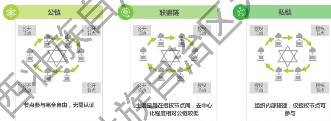
图2 区块链技术分类

区块链技术作为一种新型的信息技术，具有账本一致性、透明可追溯、不可篡改等特性，能够为数字文创产业提供完善的版权保护解决方案。其中，数字藏品是使用区块链技术的数字凭证，通过将作品上链存储在区块链网络上，利用链上信息可追溯的特性，帮助创作者实现作品确权、并对作品的权属转移和使用过程进行追溯。进一步规范了数字文创版权保护。区块链技术按去中心化程度可分为公链、联盟链及私链，公链节点参与完全自由，无需认证联盟链主要是用在授权节点间，去中心化程度相对公链较低，私链在组织内部搭建，仅授权节点可参与。目前，国内数字藏品平台大部分均由联盟链提供底层技术支持。