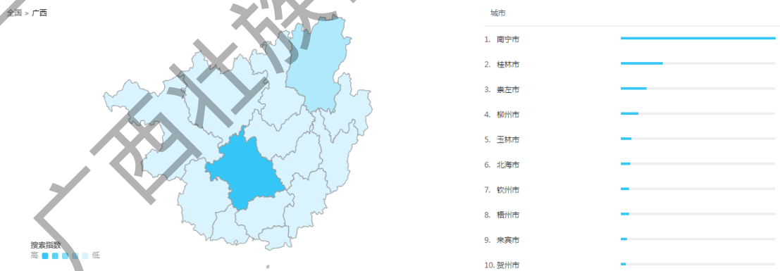
图3 对“双循环”搜索强度示意图

《方案》指出加快建设南宁、桂林国际消费中心城市，提升消费基础设施国际化水平，推动服务标准与国际接轨。这是2019年商务部发布《关于培育建设国际消费中心城市的指导意见》后，南宁和桂林明确作为建设国际消费中心城市的目标，是对于国家战略的卡位。消息一出，引起舆论强烈反响，关注度最高，设为100。南宁市、桂林市对“双循环”有关话题的搜索热度迅速靠前（图3）。